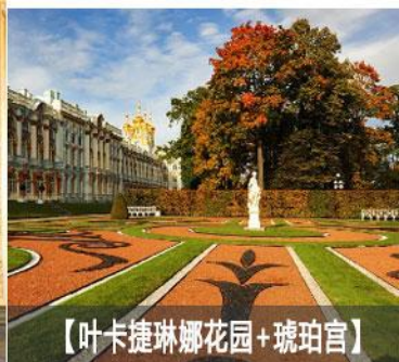
【叶卡捷琳娜花园+琥珀宫】