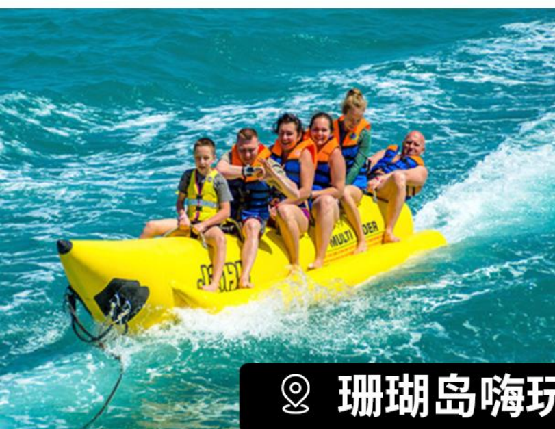
📍 珊瑚岛嗨玩水上项目