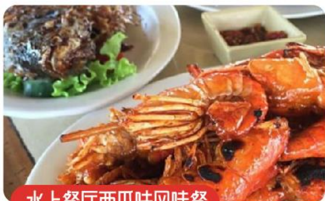
水上餐厅西瓜哇风味餐