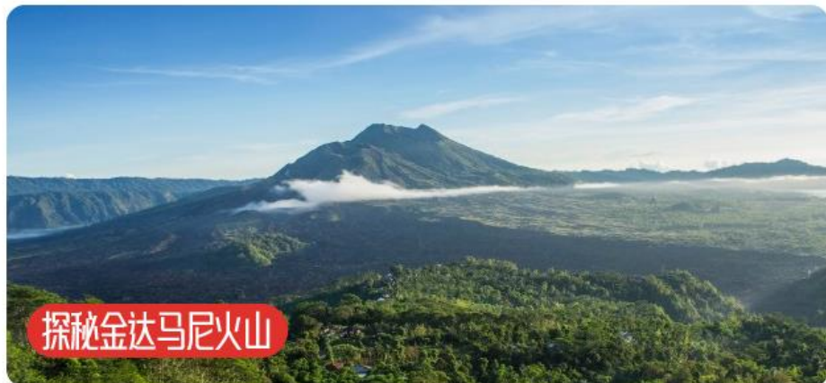
探秘金达马尼火山