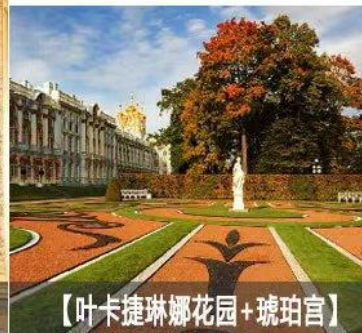
【叶卡捷琳娜花园+琥珀宫】